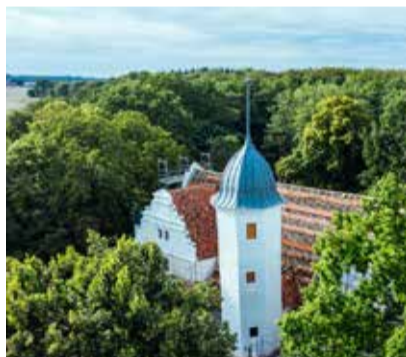
Wasserschloss Quilow

Dorfstraße 29 - 30 17209 Walow OT Lexow gutshaus-lexow.de reservierung@gutshaus-lexow.de Telefon: +49 (0)399 32 – 417 037