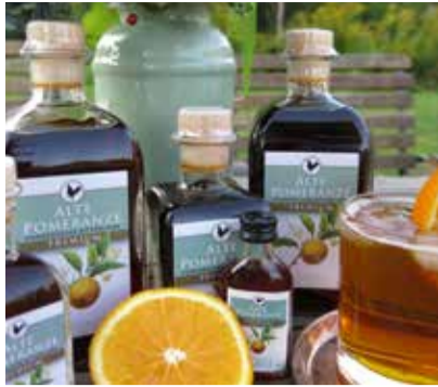
Bitterlikör aus der Gutshausmanufaktur

Zu den Linden 1 18239 Satow - OT Gorow schlossgut-gorow.de info@schlossgut-gorow.de Telefon: +49 (0) 38207 - 7537 0