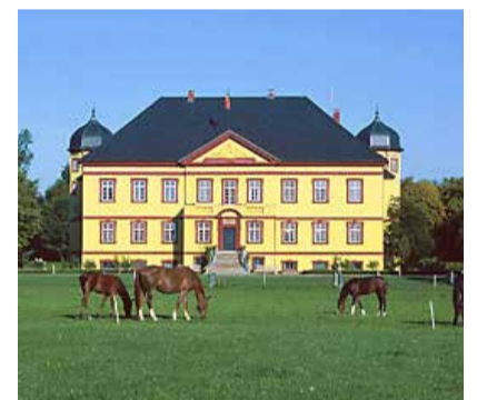
Pferde grasen vor dem Schloss

Pohnstorf 17 17166 Alt Sührkow gut-pohnstorf.de info@gut-pohnstorf.de Telefon: +49 (0) 3996 - 152 131