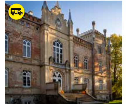
Herrenhaus Vogelsang im Herbstlicht