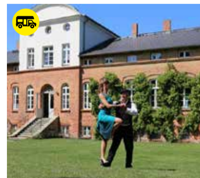
Tangokurs für alle in Pohnstorf

Am Rondel 7-8 17207 Südmüritz OT Ludorf gutshaus-ludorf.de info@gutshaus-ludorf.de Telefon: 039931-84 00