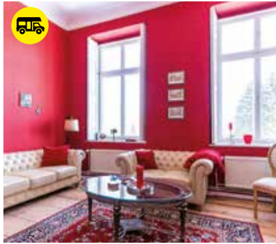
Roter Salon im Schloss Semlow