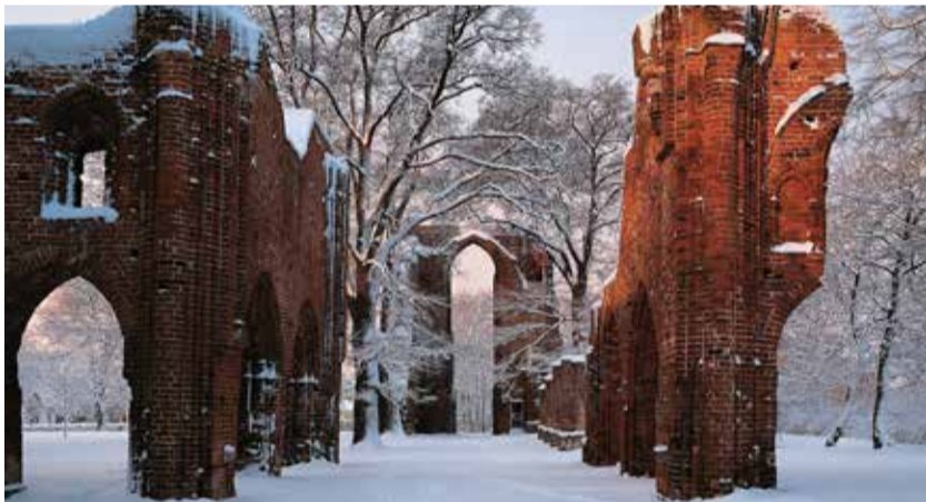
Ruine Eldena, Foto: TMV/Grundner