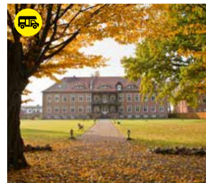
Herbst in Ludorf

Schloßstraße 4 18279 Lalenorf OT Vietgest schloss-vietgest.de info@schloss-vietgest.de Telefon: +49 (0) 38452 - 228 180