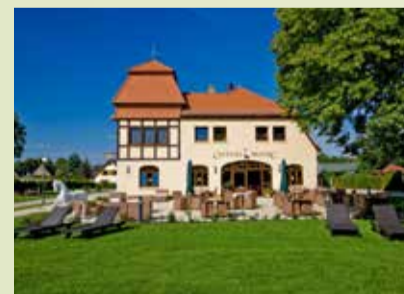
Genießen im Cheval Blanc