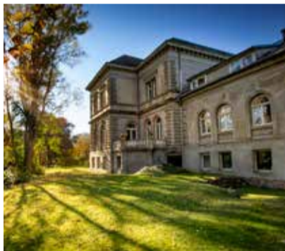
Licht auf Schlossgut Gorow

Parkstrasse 8 18334 Semlow schloss-semlow.de info@schloss-semlow.de Telefon: +49 (0)3822 - 2544990