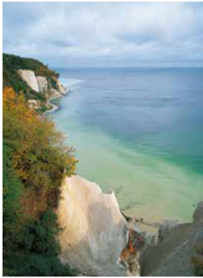
Wissower Klinken auf Rügen

Bei dem Spezial-Reise -Anbieter „Von Schloss zu Schloss Reisen“ ist der Name Programm. Buchen Sie ausgewählte Rundreisen durch wunderbare Natur in Mecklenburg-Vorpommern und kombinieren dabei mehrere Gutshäuser und Schlösser. Die Routen sind per Auto, als Wanderung oder mit dem Fahrrad zu entdecken. Das Gepäck wird transportiert und alle Sehenswürdigkeiten unterwegs sind in den Karten vermerkt. Angebote zum Schlösserherbst: