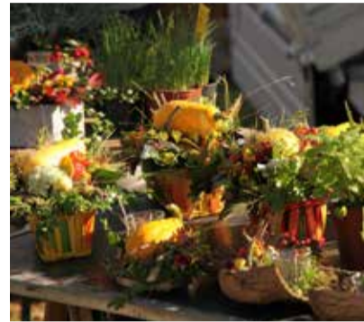
Landmarkt, Schloss Basthorst

Schlossstr. 7 17179 Behren-Lübchin OT Viecheln herrenhaus-viecheln.com mail@herrenhaus-viecheln.com Telefon: +49 (0) 176 - 342 055 34