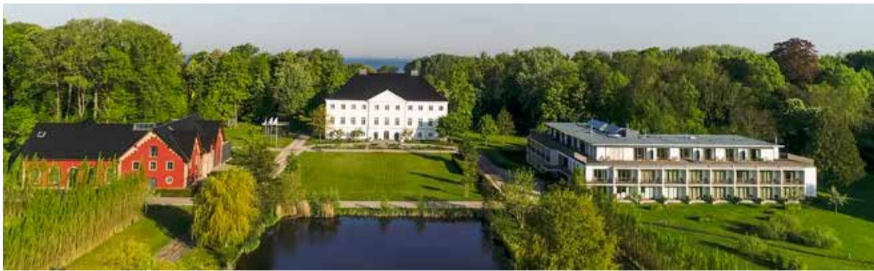
Schlossgut Gross Schwansee