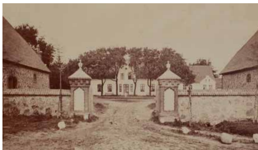
Herrenhaus Gut Carlsruhe, Ende des 1900

Entlang der Ostseeküste und im Müritz-Nationalpark sind im Herbst die Wanderungen zu den Sammelpätzen der Kraniche ein einmaliges Naturschauspiel.