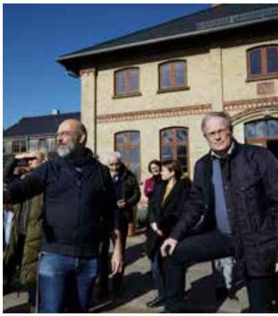
Partnertreffen auf Lexow