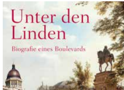
Unter den Linden. Biographie eines Boulevards, Insel Verlag, Berlin 10/2022

Samstag, 8. Oktober 16 Uhr Herbstlicher Kochkurs in vier Gängen mit Weinbegleitung. Unter dem Motto „einfach, gut, gesund“ werden regionale und saisonale Gerichte zubereitet. 130,00 € p.P.