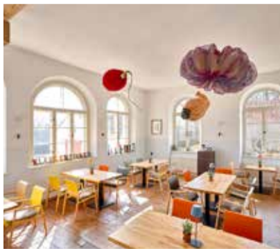
Restaurant Klassenzimmer

Das Suitehotel liegt an der Mecklenburgischen Seenplatte, zwischen der Müritz und dem Plauer See. Das klassizistische Kavaliershaus aus dem 18. Jahrhundert gehörte zur Anlage des Schlosses mit Kapelle derer von Blücher und liegt direkt am Finckener See.