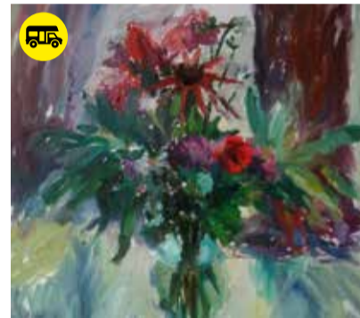
Malerei von Henning Spitzer

17209 Fincken Hofstraße 12 kavaliershaus-finckenersee.de kavaliershaus@dnalbach-architekten.de Telefon: +49 (0) 3992 - 282 700