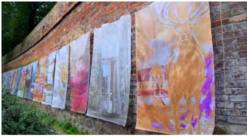
Gutshausgemälde an der Klostermauer