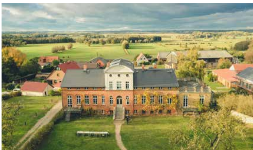
Blick in die Kulturlandschaft der Gutshäuser, Foto: Gut Pohnstorf