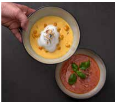
Saisonale Köstlichkeiten

Liepen 32 17139 Gielow OT Liepen wasserburg-liepen.de manufaktur@alte-pomeranze.de Telefon: +49 (0) 39957 298860