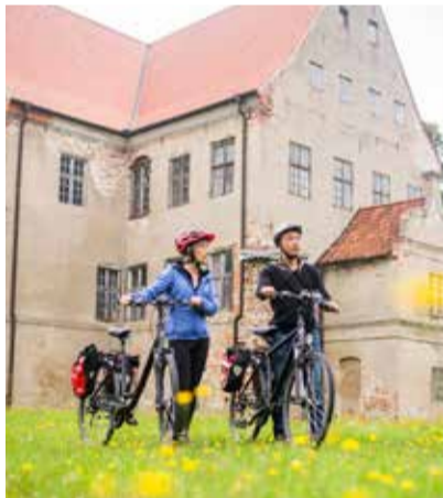
Schloss Ludwigsburg

Die Klosterruine Eldena vor den Toren Greifswalds gilt als Wahrzeichen der Romantik. Diesen Ruhm verdankt das ehemalige Zisterziens-