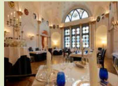
Dinieren im Wappensaal