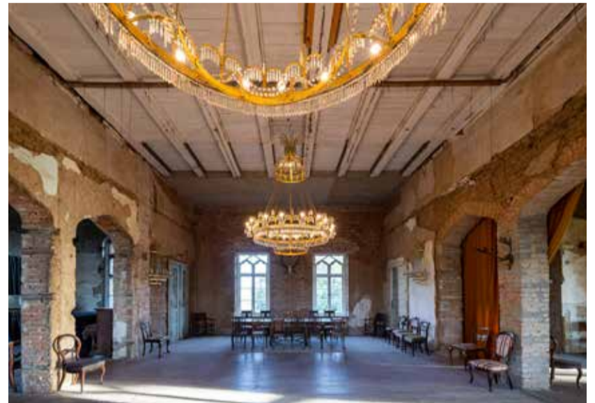
Festsaal im Herrenhaus Vogelsang

row, Schloss Vietgest, Herrenhaus Viecheln oder Schloss Daschow. Führungen, Kunst und Kulinarisches gibt es im Schloss Semlow,