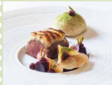
Gourmet-Küche im Landhausstil