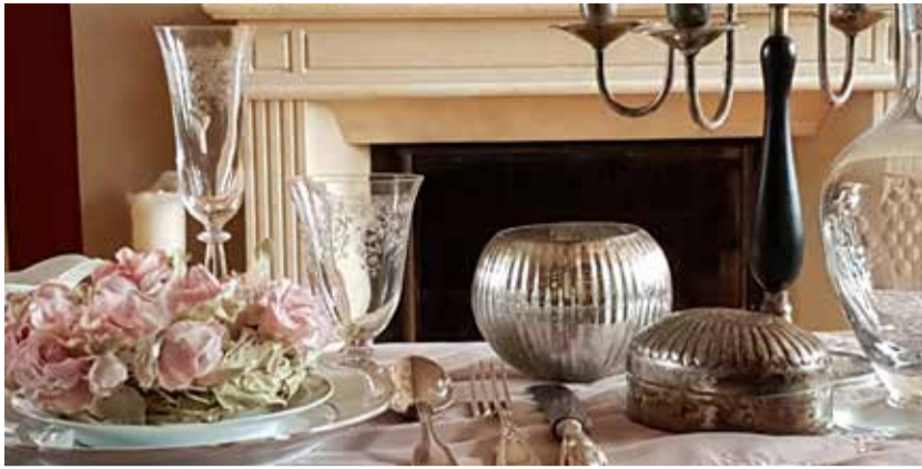
Kulinarisches im Herbst

Vielseitige kulturelle Höhepunkte und besondere Angebote im Land der 2000 Guts- und Herrenhäuser laden vom 08. - 23. Oktober 2022 zum Entdecken und Genießen ein. Ausgewählte Häuser öffnen die Türen, heizen den Ofen und heißen Besucher im Schlösserherbst