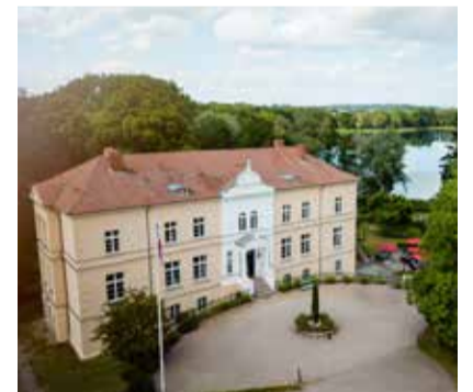
Landhotel Schloss Daschow

Lindenstraße 9 18279 Vogelsang info@herrenhaus-vogelsang.de herrenhaus-vogelsang.de