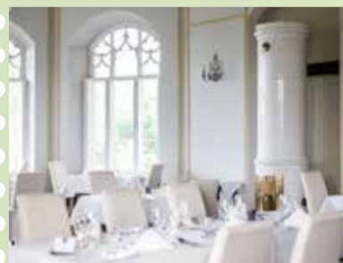
Fein speisen im Schloss

Mittwoch bis Samstag ab 18.30 Uhr, Küchenpause: 31.10. bis 13.11. Reservierung: +49 39 721 550 0 | www.gutshaus-stolpe.de