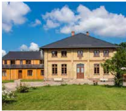
Kunst im Gut in Lexow

Schloßstraße 5 19386 Gallin-Kuppentin/Daschow landhotelschlossdaschow.de info@landhotelschlossdaschow.de Telefon: 038732 – 22 86 51