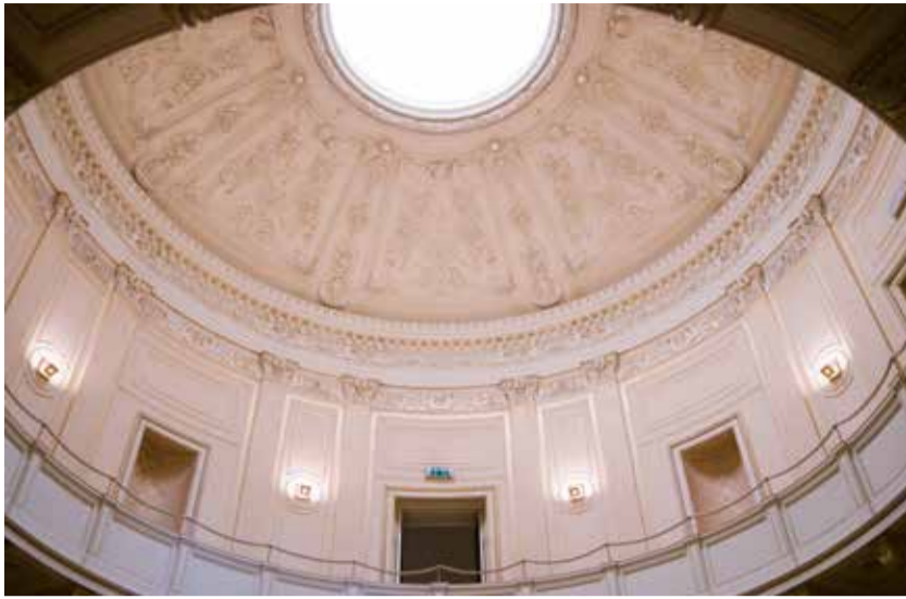
Kuppel Schloss Neetzow