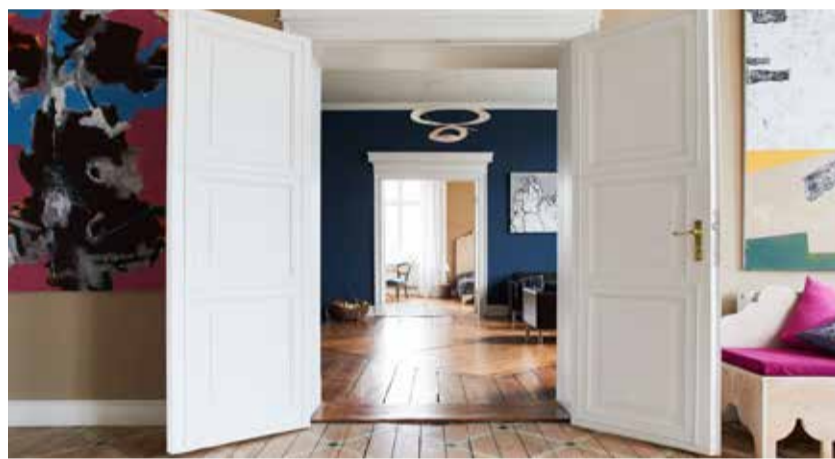
Kunst im Gut Pohnstorf

herzlich willkommen. Wenn sich draußen das Laub bunt färbt und die Lichter in den denkmalgeschützten Gutshäusern eine gemütliche Atmosphäre zaubern – wenn das Licht die Schlösser in goldenes Licht taucht und Erntedank gefeiert wird – dann