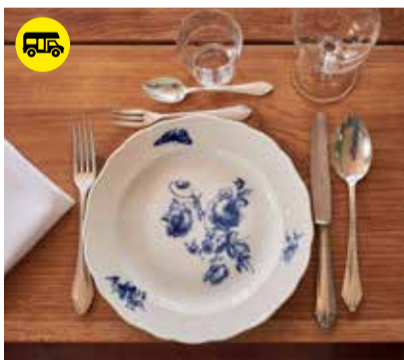
Kulinarisches in Schmarsow

Am Schloss 10 17139 Kummerow schloss-kummerow.de info@schloss-kummerow.de Telefon: +49 (0) 39952 - 235 180